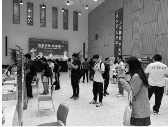
清華大學集成電路專場招募會