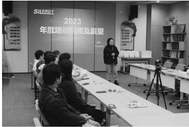
2023 年度培訓回顧及展望現場

2024 年年初，公司分別從培訓運營管理內訓師及智囊團成長之路課程申報流程，課程定級標準培訓效果評估等方面對 2023 年度培訓情況進行了整體回顧。同時為表示對各位講師一年來辛苦付出的感謝，公司為 2023 年度內訓師頒發了相應的證書和禮品。